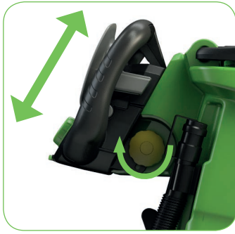
Ergonomisch: in de hoogte verstelbare bedieningshendel.