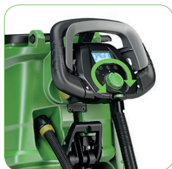
Gebruiksvriendelijk: volledige controle via 1 enkele centrale knop.