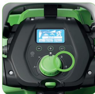
Ecologisch en economisch: 2 voorgeprogrammeerde programma's.