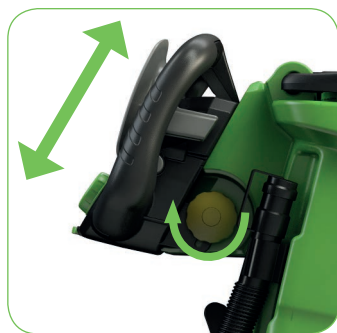
Ergonomisch: in de hoogte verstelbare bedieningshendel.