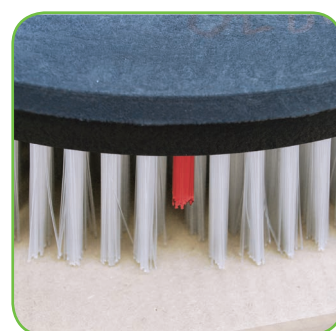
Borstel met gebruiksindicator.